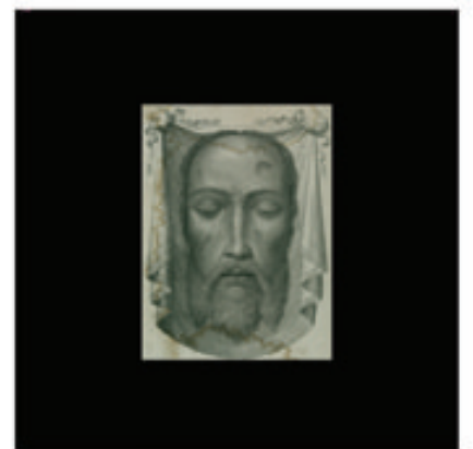
15. La Sainte Face de Tours