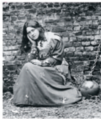
11. Ste Thérèse jouant Jeanne d'Arc