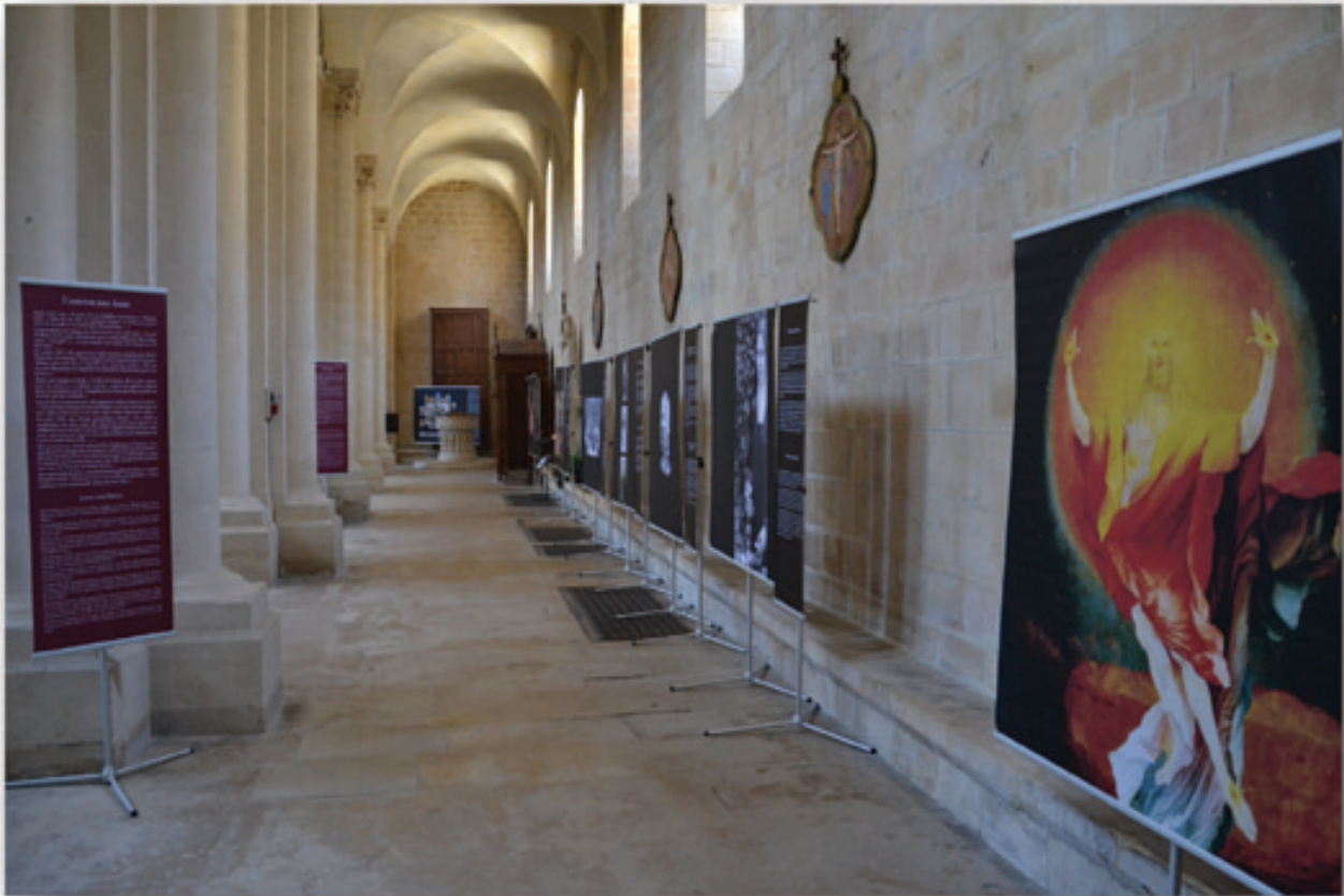
Le Touquet, Église Sainte Jeanne d'Arc.