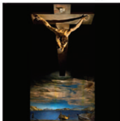
17. La Croix du Christ