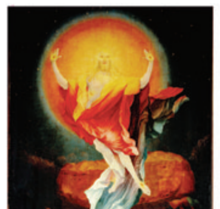
18. La Résurrection du Christ