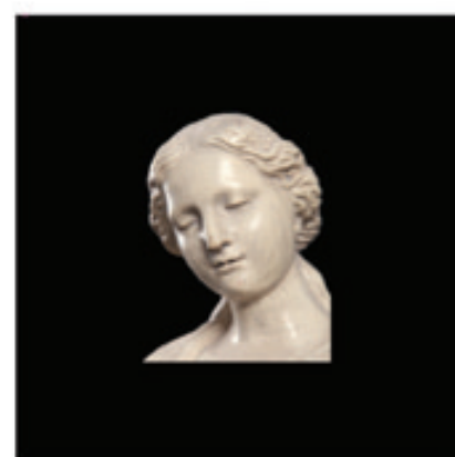
6. La Vierge du Sourire (détail)