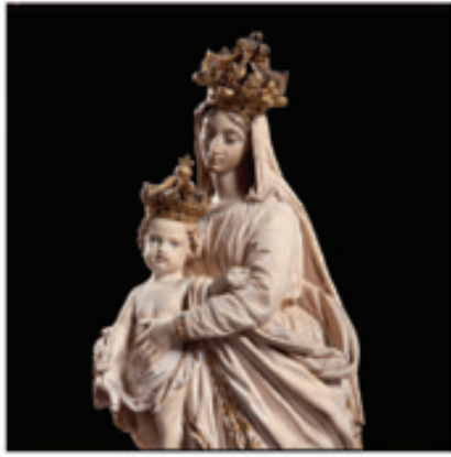
7. Notre Dame des Victoires