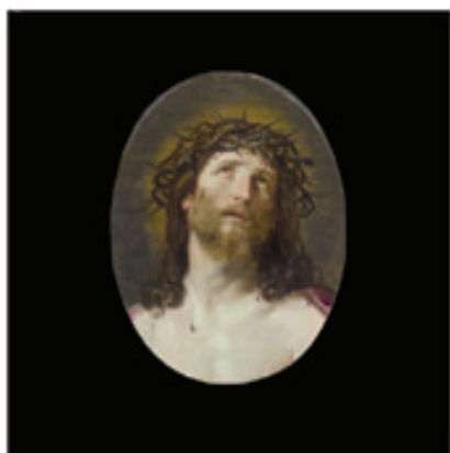
16. Le Christ Couronné d'Epines