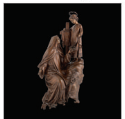
30. Une pluie de Roses