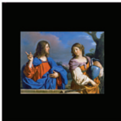
25. La Samaritaine