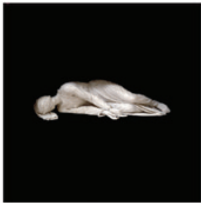
10. Sainte Cécile