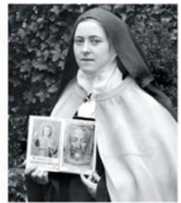
12. Thérèse avec le petit Jésus et la Sainte Face