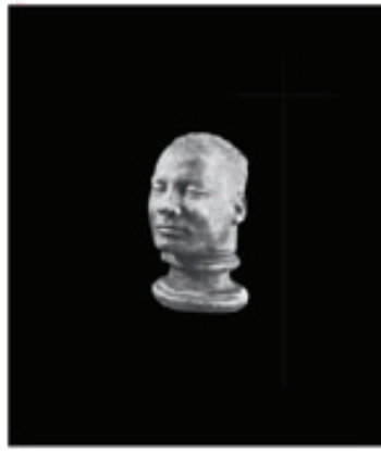
20. Henri Pranzini