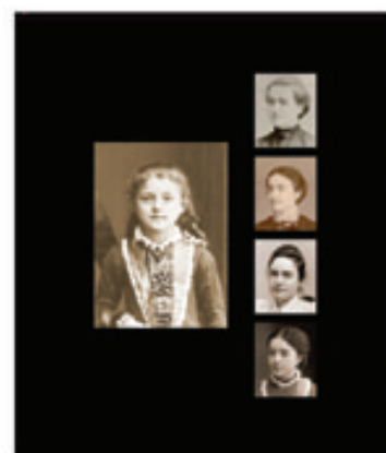
3. Les Cinq Sœurs