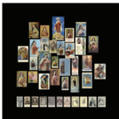
28. Thérèse Aujourd'hui, L'Amour des Hommes