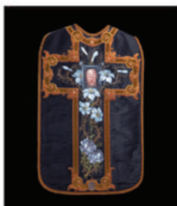
4. La chasuble peinte par Thérèse