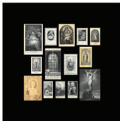
14. Les Petites Images Saintes du Christ et de la Vierge