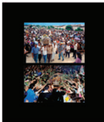
26. Thérèse Aujourd'hui, Tour du Monde des Reliques