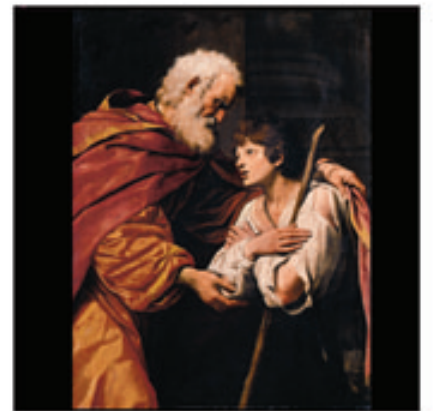
24. L'Enfant Prodigue