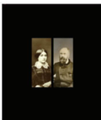
2. Louis et Zélie Martin