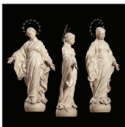
5. La Vierge du Sourire