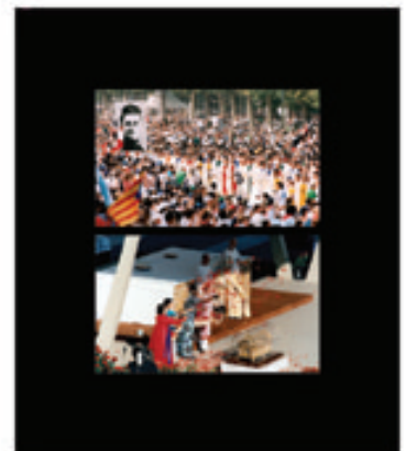
27. Thérèse Aujourd'hui, Docteur de l'Eglise