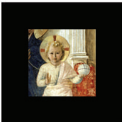
13. Jésus enfant