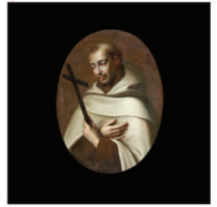
9. St Jean de la Croix