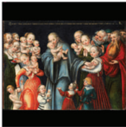
23. Le Christ et les Petits Enfants