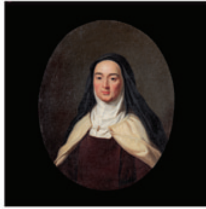
8. Ste Thérèse d'Avila