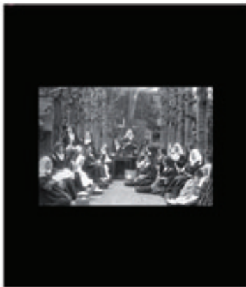
22. Thérèse et la Vie Communautaire