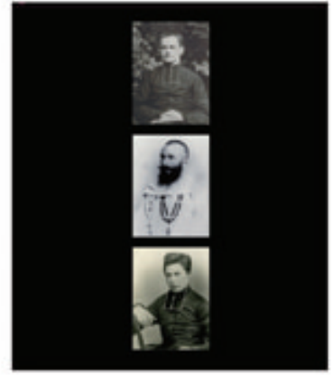
21. Thérèse et la Mission